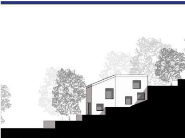
ANSICHT PROJEKT OLMO OST