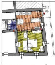
APPARTAMENTO "C" - P.M. 8 PRIMO PIANO

Appartamento con accesso privato, ampio soggiorno sala da pranzo con angolo cottura, 1 bagno, 1 camera matrimoniale e 1 camera singola. L'appartamento ha altezza di 2,37m.